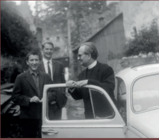
LORS D'UN VOYAGE EN GRANDE BRETAGNE.