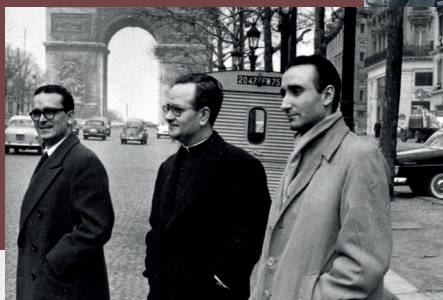
À PARIS, LE 4 JANVIER 1959.