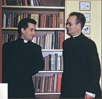
MGR. JAVIER ECHEVARRÍA, TOEKOMSTIGE BISSCHOP-PRELAAT VAN HET OPUS DEI (LINKS) MET DE DIENAAR GODS IN LONDEN.