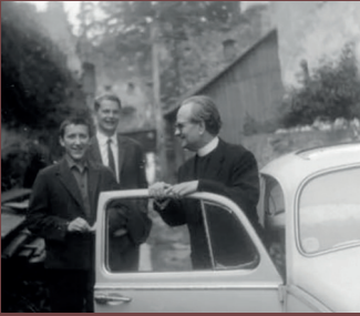
TIJDENS EEN REIS DOOR GROOT BRITANNIË.