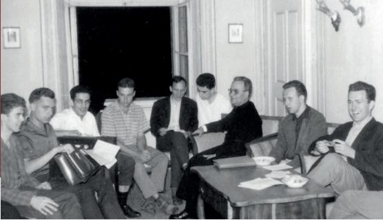
EEN MOMENT GEZELLIG SAMENZIJN IN OOSTENRIJK (1963).

In een van de bezinningen die hij op het einde van zijn leven schreef, toen hij niet meer in staat was te prediken, zegt hij: “Vertrouwen om de zaken zoals ze komen te aanvaarden: bv. wanneer wij niet in goede gezondheid zijn, wanneer iets professioneel niet verloopt volgens onze plannen, wanneer familiale tegenslagen