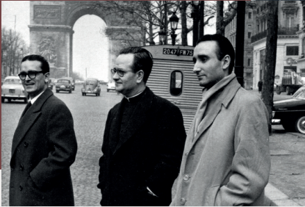
IN PARIJS, OP 4 JANUARI 1959.